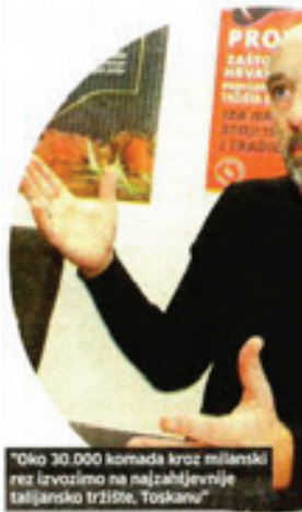
"Oko 30.000 komada kroz milanski rez izvozimo na najjahtjevnije talijansko tržište, Toskanu"

Naše je selo prazno i devastirano i koliko god se to pokušavalo vratiti na negdašnju razinu, nije se uspjelo. Dapače, svake godine broj obiteljskih poljoprivrednih gospodarstava opada